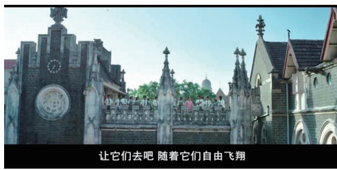
让它们去吧 随着它们自由飞翔

我想嗝嗝老师成功的原因并不是因为她有多么高的学历和教学水平，而是她自己本身。她克服了自己的障碍，忍受了所有不屑的眼光与无情的嘲讽，不卑不亢，敢于站