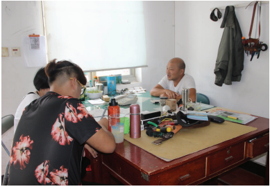
今年暑假期间,因受强台风“灿鸿”的

外围影响,台州学院临海校区多处出现了不同程度的水泵进水、泥沙淤积、围墙倒塌等问题,严重影响正常生活。台风突袭在给学校造成了极大破坏的同时,也给校后勤服务管理处带来了极大的压力。为了能及时修缮,保障学生开学后的日常用水用电,校后勤服务管理处水电与维修服务中心在接到上级指示后,立即组织技术人员进行抢修、清理道路,也及时解决了寝室等生活区域进水的问题。鉴于学校采用的地下埋线设计避免了电线进水、短路等安全问题,可以放心使用。