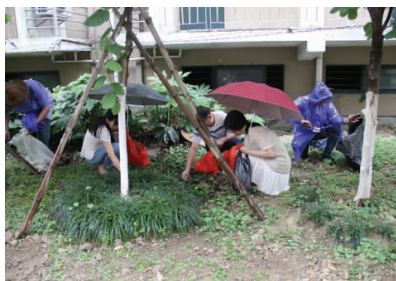
为净化校园环境,加大控烟宣传,倡导师生积极参与控烟履约工作,推进我校“无烟校园”创建工作,根据校爱卫会《关于开展第30个世界无烟日宣传活动和控烟工作的通知》文件要求,6月1日下午,校爱卫会联合团委组织学生志愿者在椒江校区开展捡烟蒂倡禁烟系列活动。

学生志愿者在校爱卫会、校园保洁人员带领下,分三组重点清除教学楼、生活区周边道路及绿化带等区域的烟蒂和白色垃圾。蒙蒙细雨中,志愿者们手提垃圾袋,穿梭在草坪和绿化带中,细心地捡拾烟蒂、废纸等垃圾并集中扔到垃圾箱里。经过大家的努力,教学楼、生活区周边及绿化带面貌焕然一新,为师生带来更加整洁、卫生的生活和学习环境。